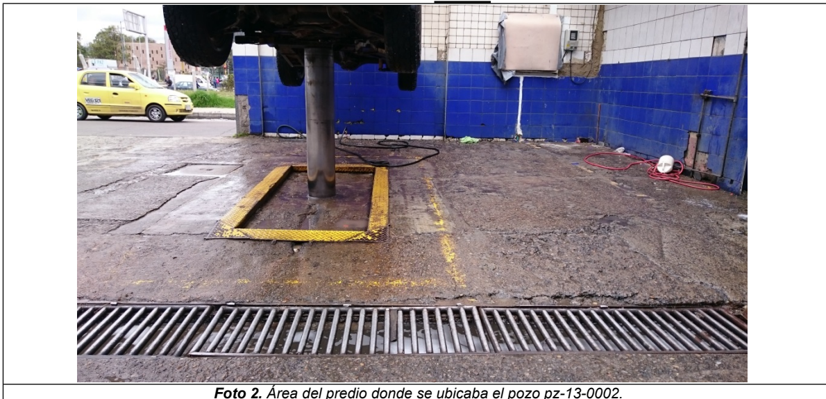
Foto 2. Área del predio donde se ubicaba el pozo pz-13-0002.